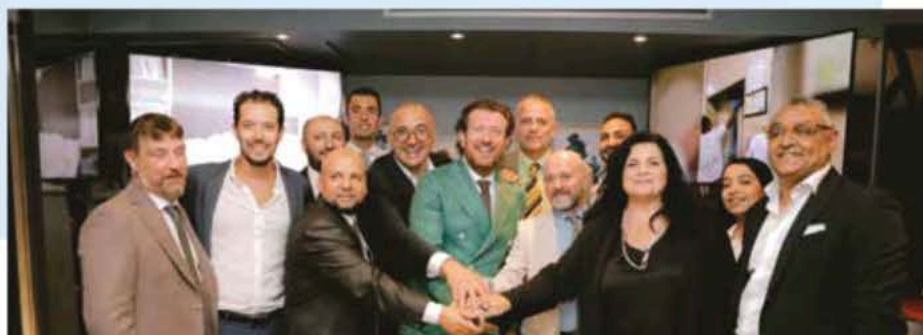
Sopra, un momento di formazione in aula A lato, l'evento di inaugurazione a Il Cairo