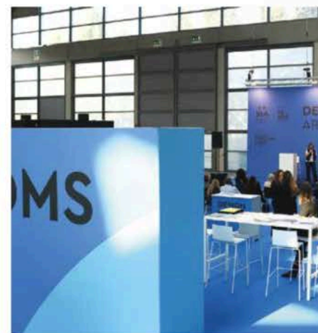
Una delle arene per i meeting

prossimi anni bisognerà essere più equilibrati perché non si può fare a meno della clientela nazionale che garantisce occupazione durante tutto l'arco dell'anno. La stagionalità estiva si sta allungando grazie agli stranieri e al clima. Resta centrale il problema delle risorse umane perché per garantire, soprattutto nell'ospitalità upscale, una proposta di servizi di eccellenza, il fattore umano è essenziale". Una soluzione a questo problema l'ha presentata a Rimini l'azienda veronese Velox Servizi : per ovviare alla carenza di personale specializzato nel mondo dell'accoglienza, ha creato un'academy per la formazione che è in grado di specializzare gli addetti direttamente in albergo. Inaugurata la prima scuola a Il Cairo, in Egitto, la pratica si svolge poi alle porte di Verona, al Muraless Art Hotel , albergo decorato con murales dei più noti esponenti di questa forma d'arte. "Non sono semplici programmi di apprendistato - ha detto Gianmaria Villa , presidente di Velox Servizi -, ma un vero tirocinio formativo integrato nel piano di studi che permette agli studenti di applicare le conoscenze acquisite in aula in un ambiente reale, lavorando sotto la guida di professionisti esperti".